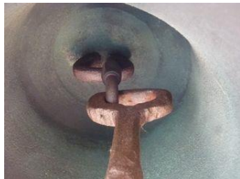
La bélière et le baudrier