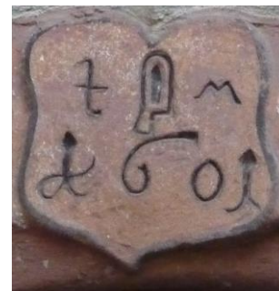
Emblème de 1601 Initiales T.M. (n° 17 rue Saint Nicolas à Riquewihr)

Information : dans l'Annuaire de la Société d'Histoire et d'Archéologie de Dambach-la-Ville 2011, Barr, Obernai, parution d'un article : « Etat des fermages payés sur les biens de l'Abbaye d'Andlau à Mittelbergheim –essai de datation d'un parchemin du XIVème ou XVème siècle ».