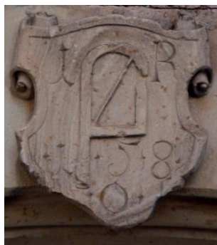
Emblème de 1580 Initiales I.R (rue de l'école à Rosheim)

Aucune représentation de l'emblème des tuiliers n'est visible à Mittelbergheim, mais il se retrouve dans d'autres localités. Il comporte un ou plusieurs gabarits à modeler les tuiles plates en « queue de castor ». Le motif de Riquewihr a été repris dans la signalétique de la Ziegelscheuer de Mittelbergheim.