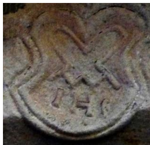
Emblème de 1611 Initiales I H S (n° 22 rue Saint Nicolas à Riquewihr)

Aucune représentation de l'emblème des tuiliers n'est visible à Mittelbergheim, mais il se retrouve dans d'autres localités. Il comporte un ou plusieurs gabarits à modeler les tuiles plates en « queue de castor ». Le motif de Riquewihr a été repris dans la signalétique de la Ziegelscheuer de Mittelbergheim.